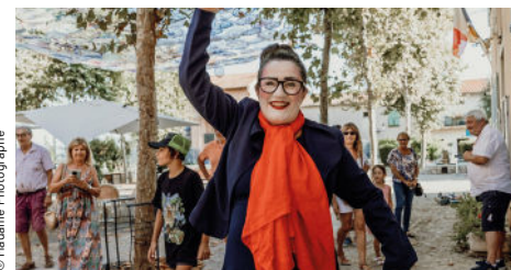
Cie l'Embrayage à Paillettes, 2025