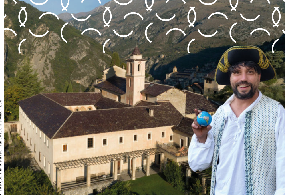
Visite gourmande avec Francesco