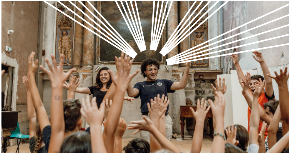
Atelier enfants, Breil-sur-Roya, 2025