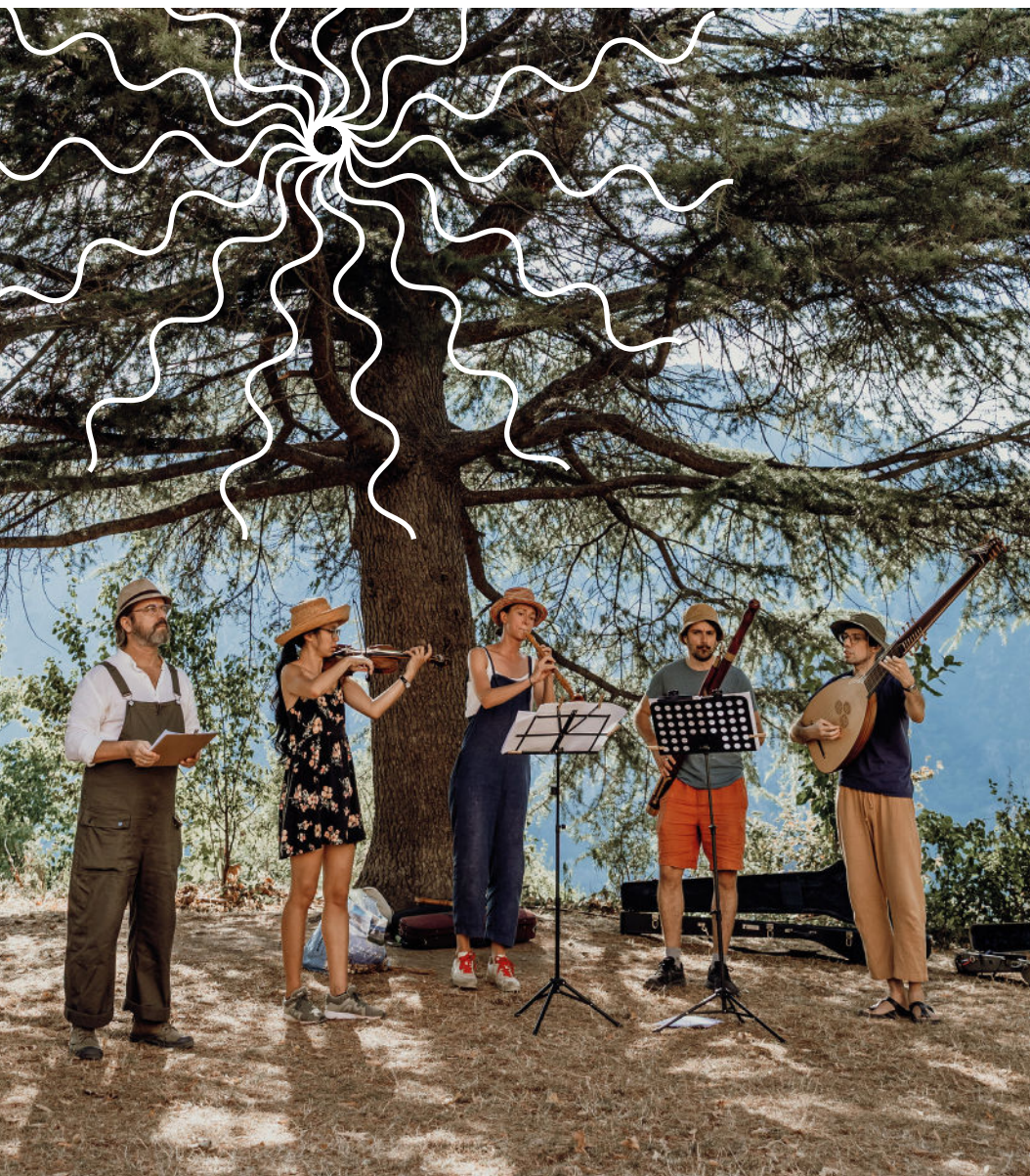
Balade musicale au Monastère avec les musiciens du festival, 2025