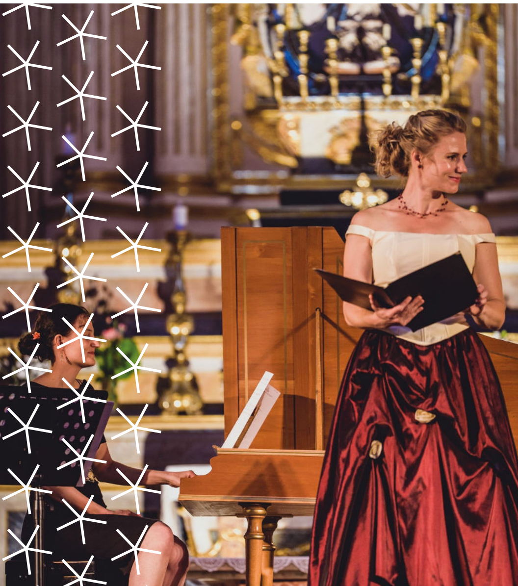
La Chambre, Les Baroquiadés 2024