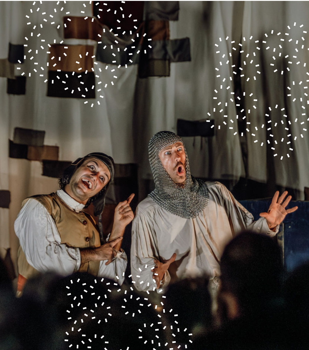
Don Quichotte, Cie Aidas, Trophée d'Auguste, La Turbie, 2025