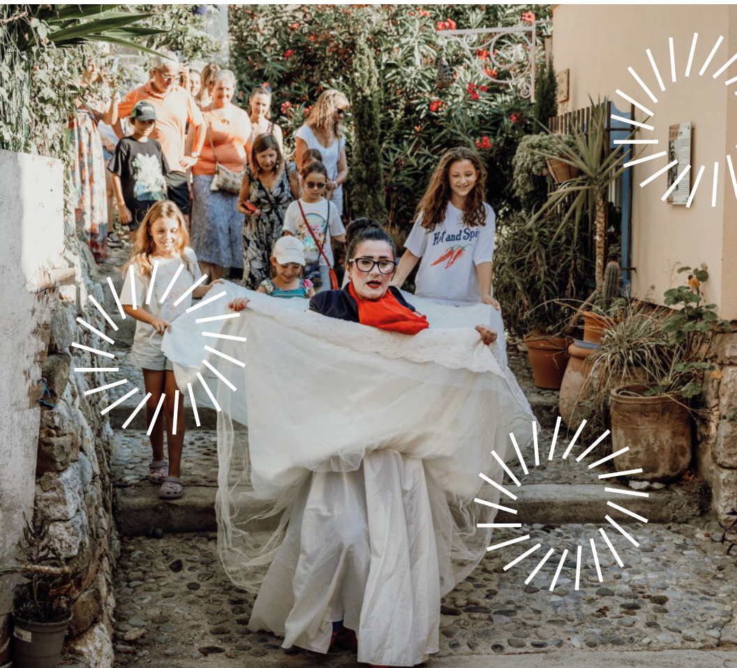
Compagnie de l'Embrayage à paillettes, Castellàr, 2025