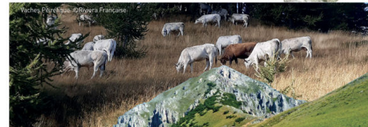
Vaches Pérelle