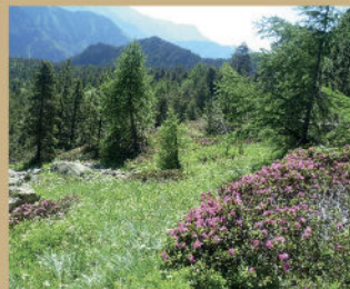
Mélezins et Rododendron