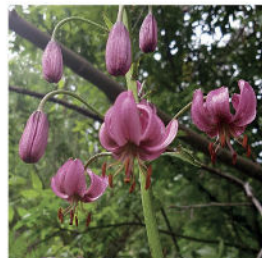
Lis Martagon ©Lieder Myrtillo