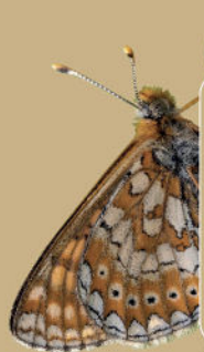
Damier de la Succise

27 165 sites en Europe dont 1 761 en France 128 en Région Sud 16 130 ha de la Riviera française en zone Natura 2000