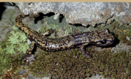
Spélépèdes de Strinati

Cette géographie favorise un climat spécifique et une biodiversité remarquable. Sur les 6 sites Natura 2000 du territoire (5 terrestres et 1 marin), plus de 80 espèces animales patrimoniales et 50 espèces végétales protégées y sont recensées, dont certaines sont rares ou endémiques.