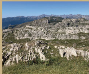
Plateau du Marguareis