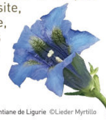
Gentiane de Ligurie

Chaque année, des suivis réguliers sont organisés pour suivre l'évolution des populations et adapter les actions de conservation du site, que ce soit en faveur de la faune, avec notamment un focus sur les chauves-souris, ou de la flore, à travers l'étude des orchidées présentes sur les restanques de pelouses sèches.