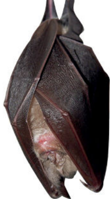
Grand rhinocéros

L'adoption de bonnes pratiques est essentielle pour limiter les effets néfastes sur la nature et prévenir les dérangements ou dégradations des milieux naturels.