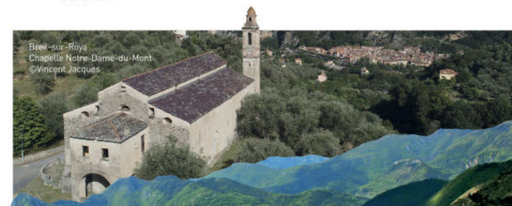
Breil-sur-Roya Chapelle Notre-Dame-du-Mont

Grâce à des contrats Mesures agroenvironnementales et Climatiques (MAEC), les éleveurs s'engagent en faveur de pratiques respectueuses des milieux naturels du site.