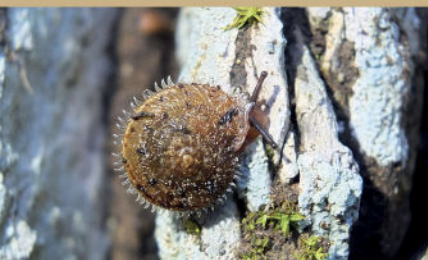
Citiella ciliata

Cette géographie favorise un climat spécifique et une biodiversité remarquable. Sur les 6 sites Natura 2000 du territoire (5 terrestres et 1 marin), plus de 80 espèces animales patrimoniales et 50 espèces végétales protégées y sont recensées, dont certaines sont rares ou endémiques.