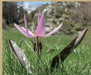
Érythron dent-de-chien