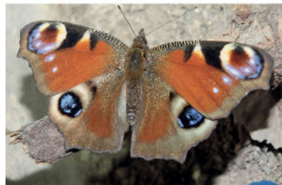
Paon du jour - Inachis io