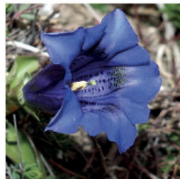
Gantiane de Ligurie

L'église de la Madone du Mont, classée monument historique, abrite trois colonies exceptionnelles de plus de 1 500 chauves-souris, l'une des plus importantes de France. Ce gîte accueille plusieurs espèces protégées, dont le Rhinolophe Euryale, le Grand Rhinolophe et le Murin à oreilles échanquées.