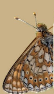
Damier de la Succise

27 165 sites en Europe dont 1 761 en France 128 en Région Sud 16 130 ha de la Riviera française en zone Natura 2000