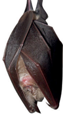
Grand rhinolophe

L'adoption de bonnes pratiques est essentielle pour limiter les effets néfastes sur la nature et prévenir les dérangements ou dégradations des milieux naturels.