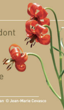
Lis turban