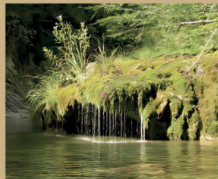
Cascade de Tufs