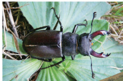
Lucane cerf volant