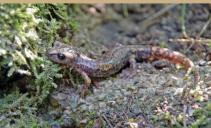
Spéleomante de strinati

Cette géographie favorise un climat spécifique et une biodiversité remarquable. Sur les 6 sites Natura 2000 du territoire (5 terrestres et 1 marin), plus de 80 espèces animales patrimoniales et 50 espèces végétales protégées y sont recensées, dont certaines sont rares ou endémiques.