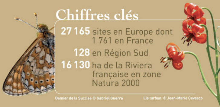
Damier de la Succise

27 165 sites en Europe dont 1 761 en France 128 en Région Sud 16 130 ha de la Riviera française en zone Natura 2000