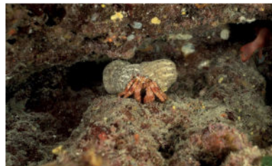
Bernard l'Hermitte