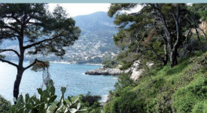
Sentier des douner au Cap Martin

Cette géographie favorise un climat spécifique et une biodiversité remarquable. Sur les 6 sites Natura 2000 du territoire (5 terrestres et 1 marin), plus de 80 espèces animales patrimoniales et 50 espèces végétales protégées y sont recensées.