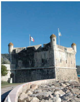
Musée du Bastion - Jean Cocteau, Menton.