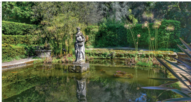
Jardin Serre de la Madone.