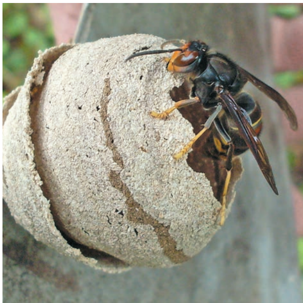
Frelon asiatique sur nid primaire